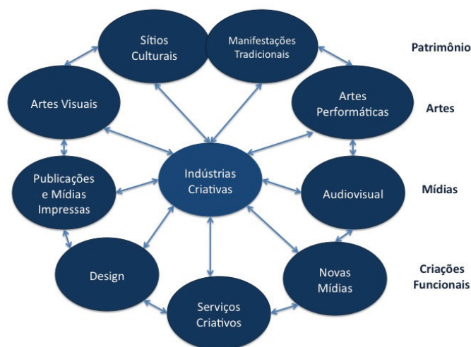
FIGURA 2: Classificação das Indústrias Criativas